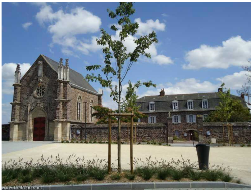
Chapelle Saint-Joseph