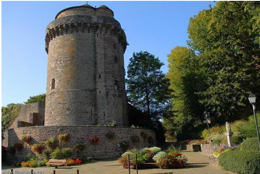
Tour Papegaut