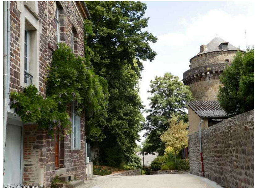
Tour du Papegaut