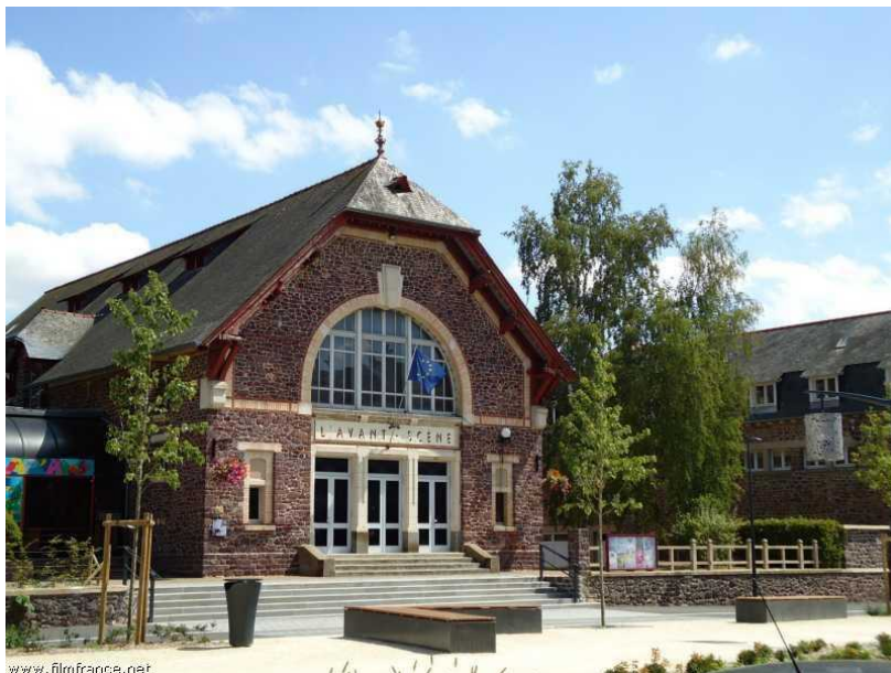
Centre culturel