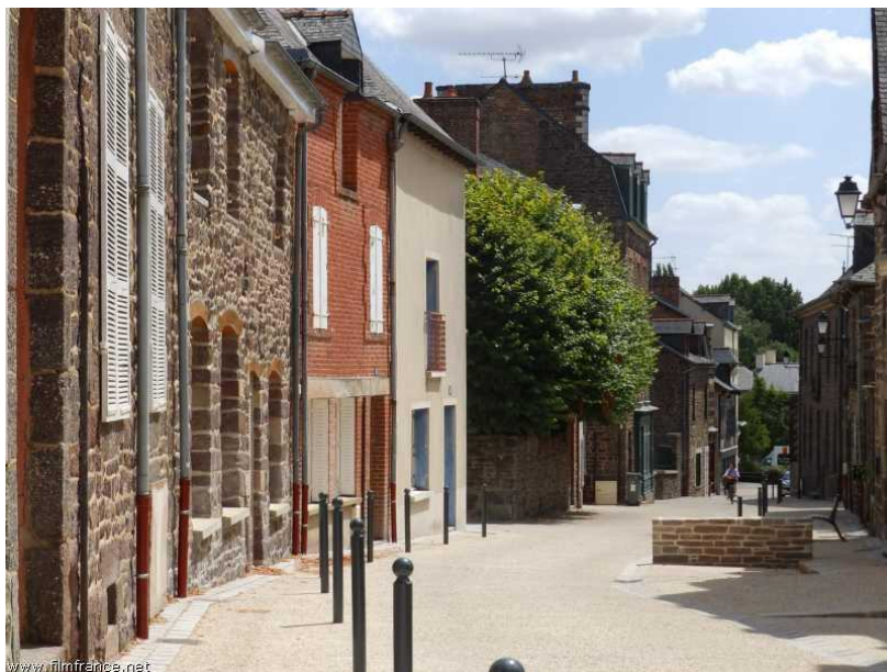
Rue de la Saulnerie