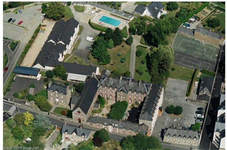
Vue aérienne - © ATB - Hôtel de l'Abbaye