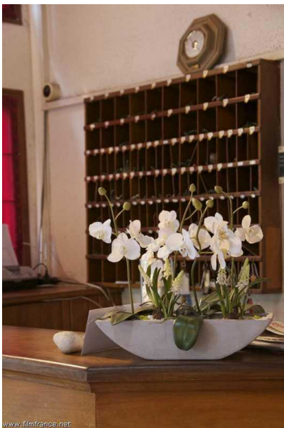
Réception - © ATB - Hôtel de l'Abbaye