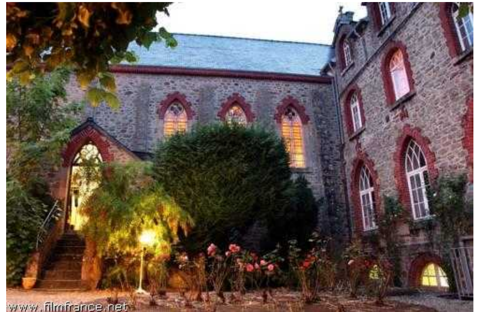
Cour - Hôtel de l'Abbaye