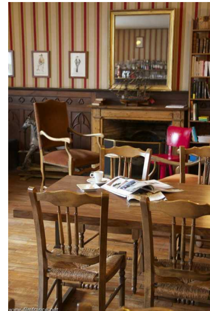
Salon - Hôtel de l'Abbaye