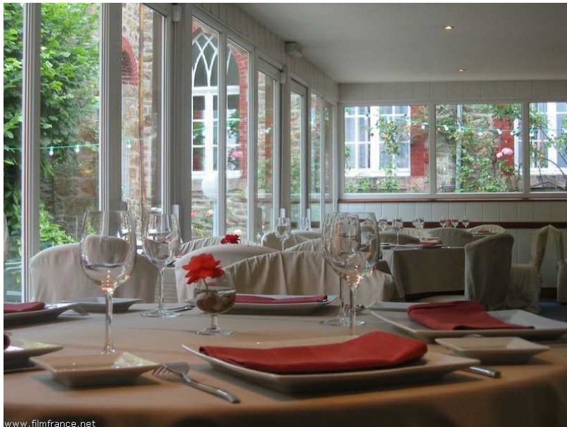
Salle de restaurant - © ATB - Hôtel de l'Abbaye