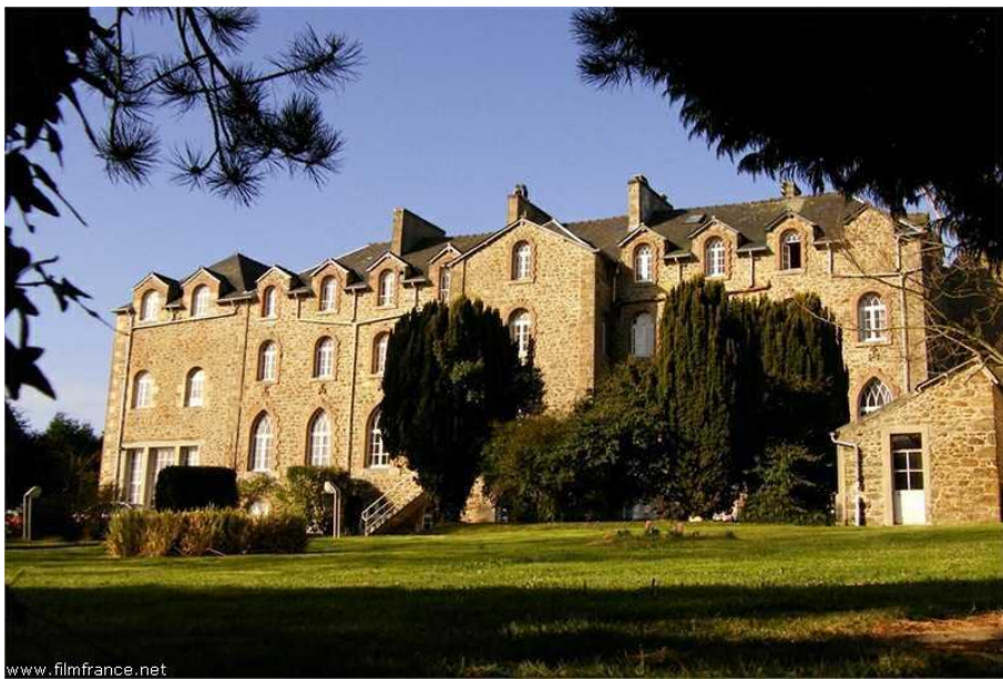
Façade principale - Hôtel de l'Abbaye