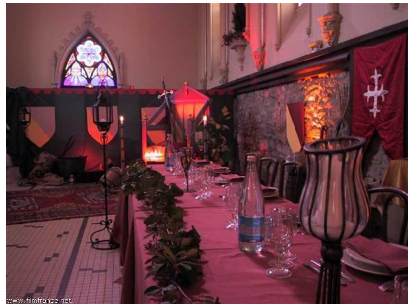
Salle chapelle - © ATB - Hôtel de l'Abbaye