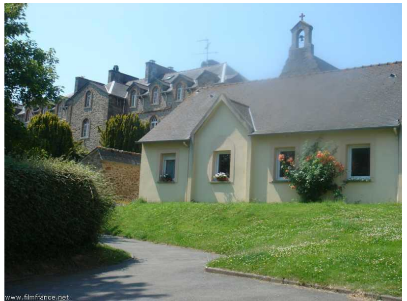
Partie moderne - © ATB - Hôtel de l'Abbaye