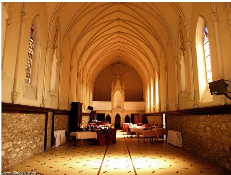
Intérieur chapelle - Hôtel de l'Abbaye