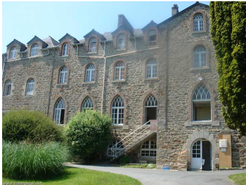
Façade - Hôtel de l'Abbaye