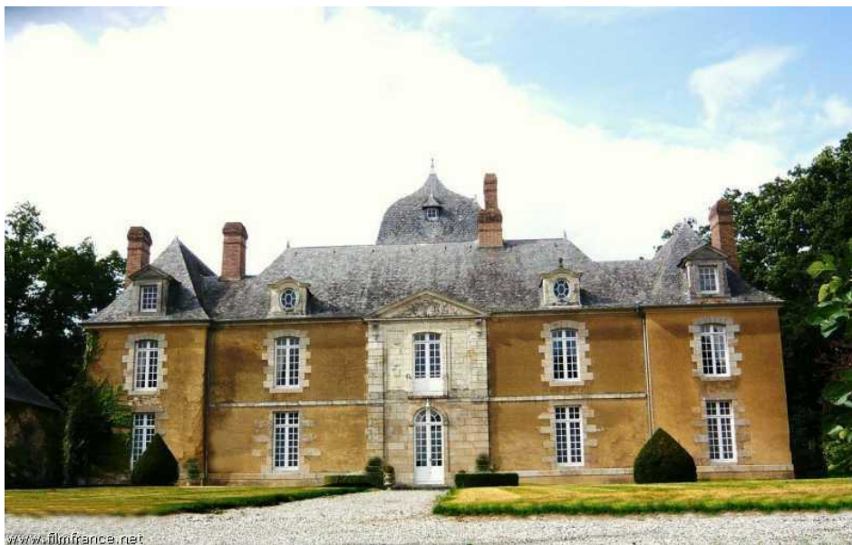
Façade sud