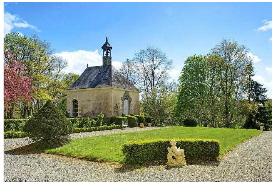
La terrasse