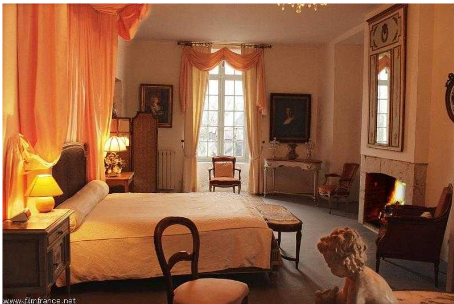
Autre chambre