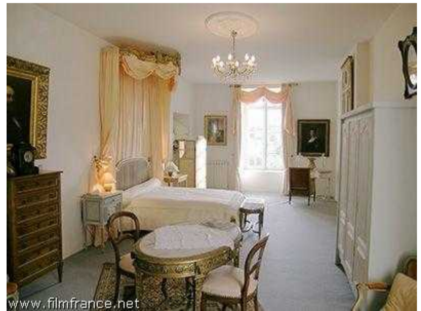
suite les angelots