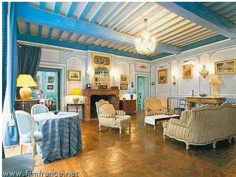
salon bleu