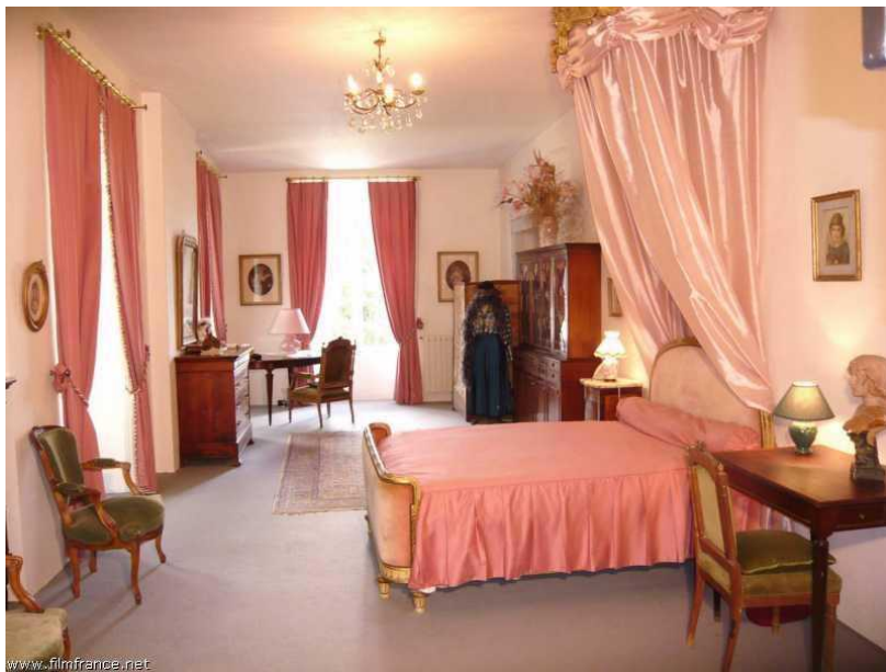
suite roses tremières