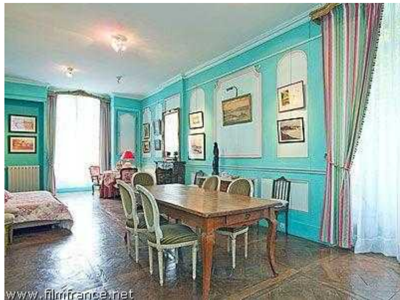
salon turquoise