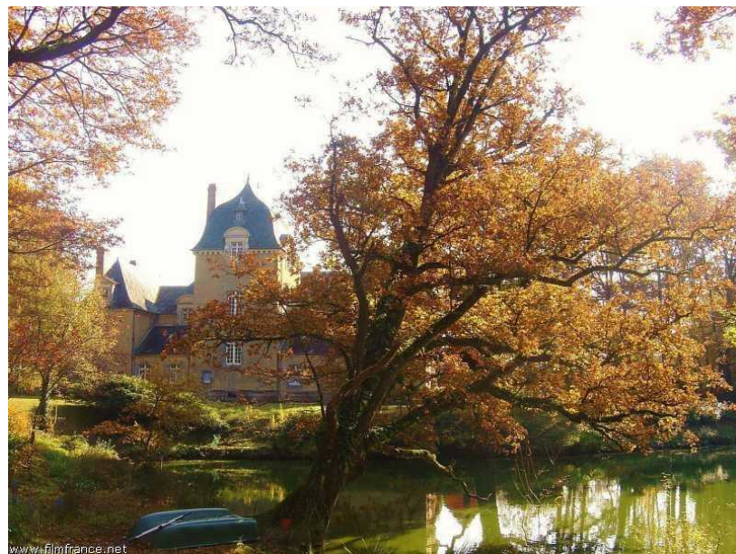
façade nord