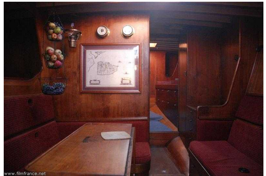
Carré central