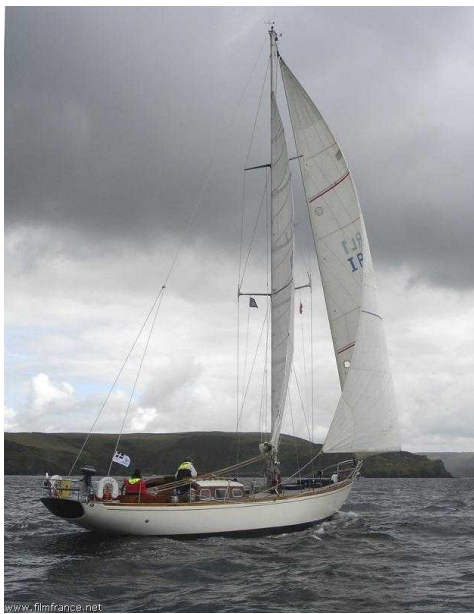
Au large