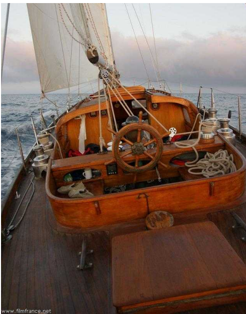
Carré extérieur