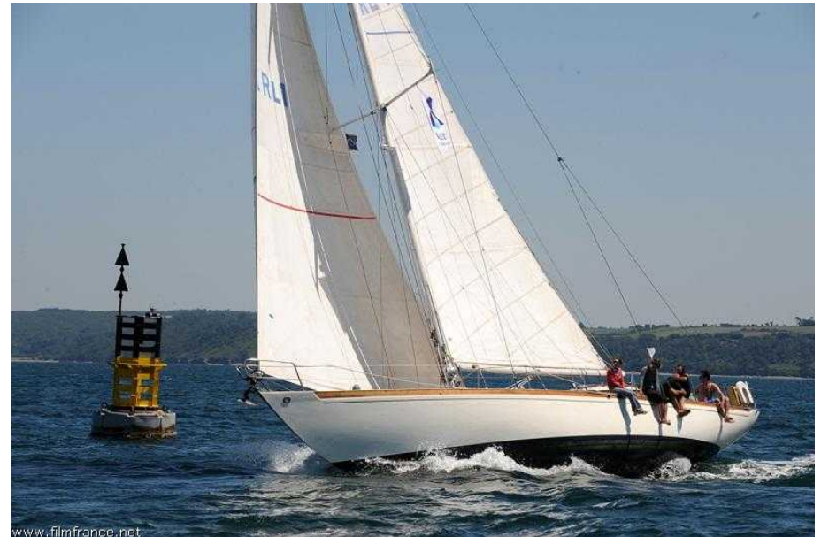
Au large