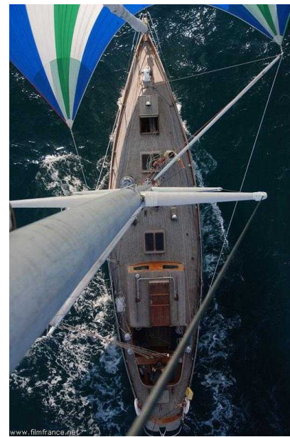
Vu du haut du mât