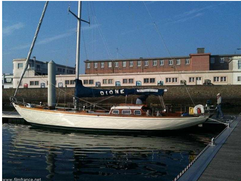
A quai