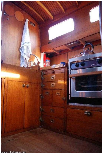
Cuisine - © ATB / SE