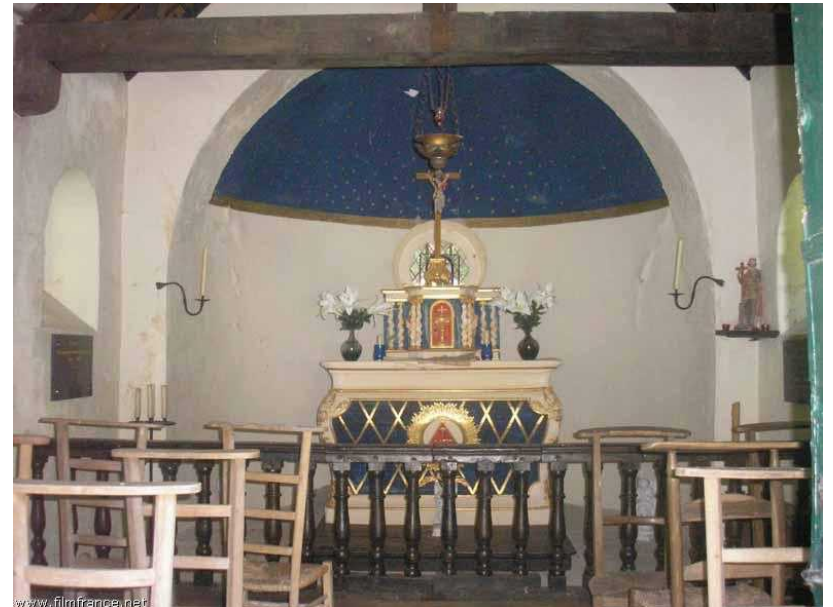
Intérieur de la chapelle