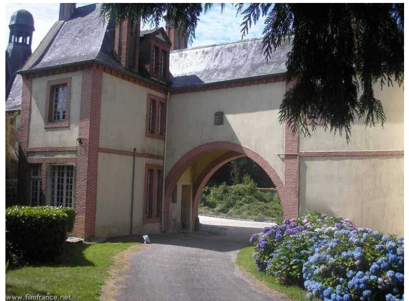
Le porche - © ATB / © L J