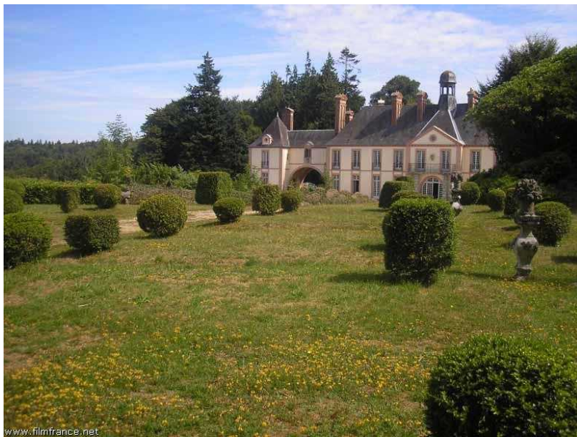
Façade principale ouest