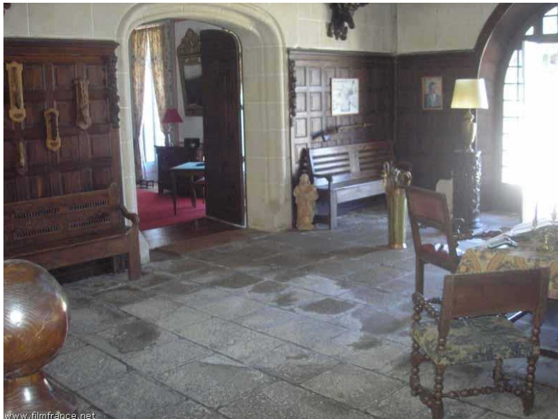
Hall d'entrée