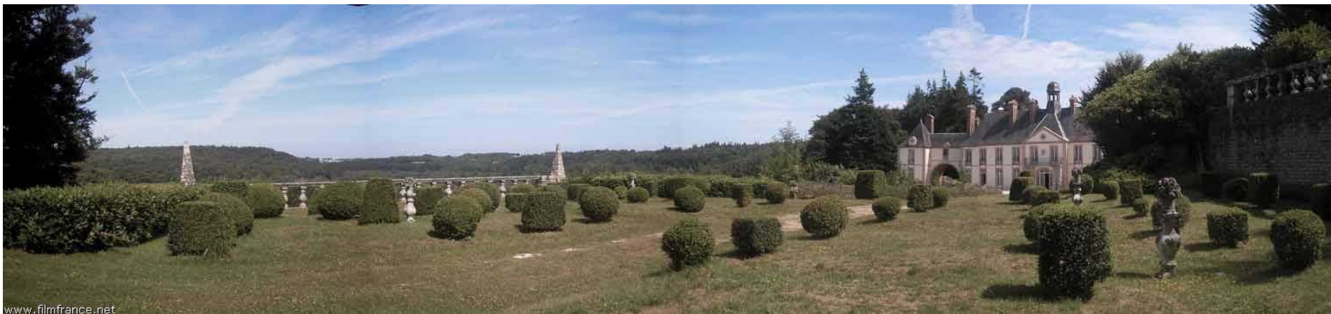
La façade Est du château