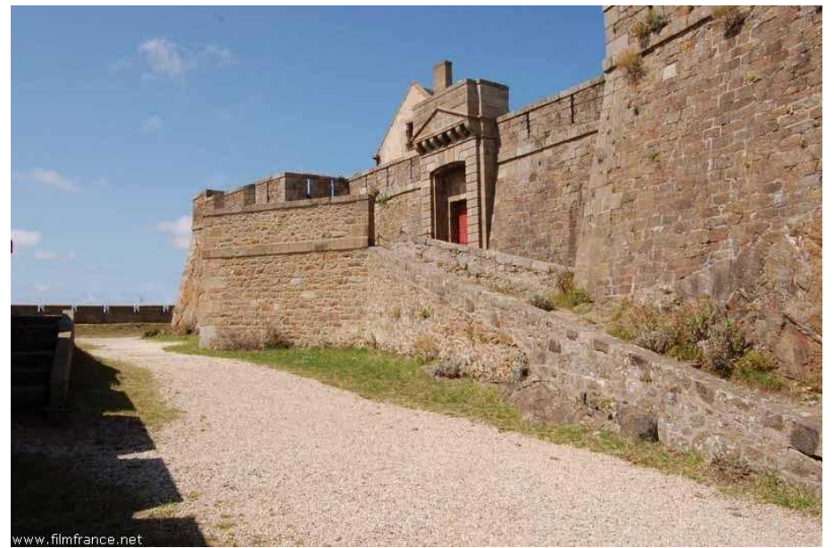
Mur d'enceinte