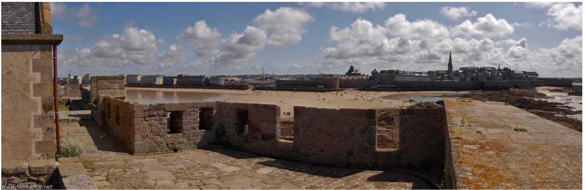
Fiche de prérepérage du décor N° : 48777