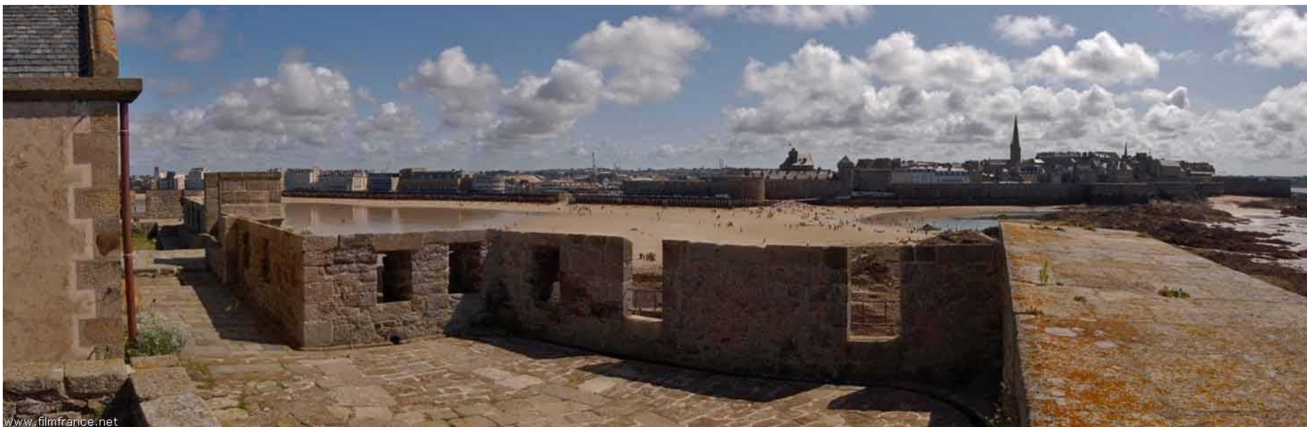
Fiche de prérepérage du décor N° : 48777