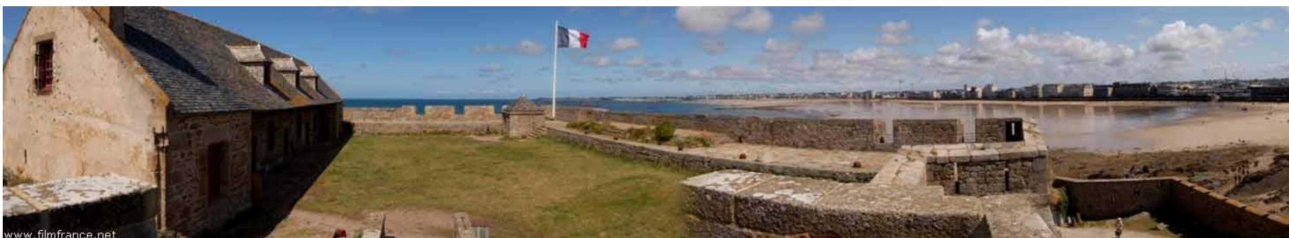
Cour et vue sur la ville