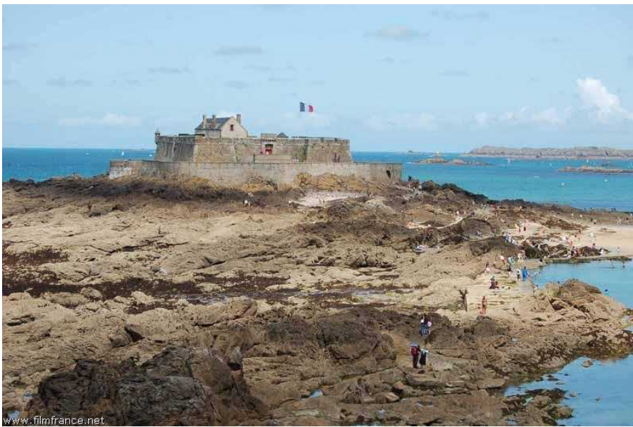
Vue d'ensemble